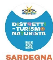
Tavola rotonda & aperitivo